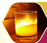
הרב יהודה לייב הלוי אשלג - י' בתשרי