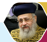
מן הראש"צ הרה"ג יצחק יוסף שליט"א